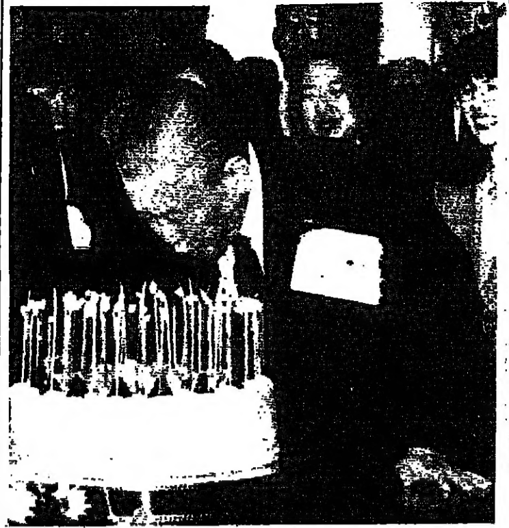
نوبور تاكيشيتا، رئيس وزراء لبنان، يطبخ الشوع الغروسية في قلب الحلوى الذي قدمه له الموظفون في مكتبه في ٢٦ الجاري بمناسبة عيد ميلاده الخامس والسبعين.